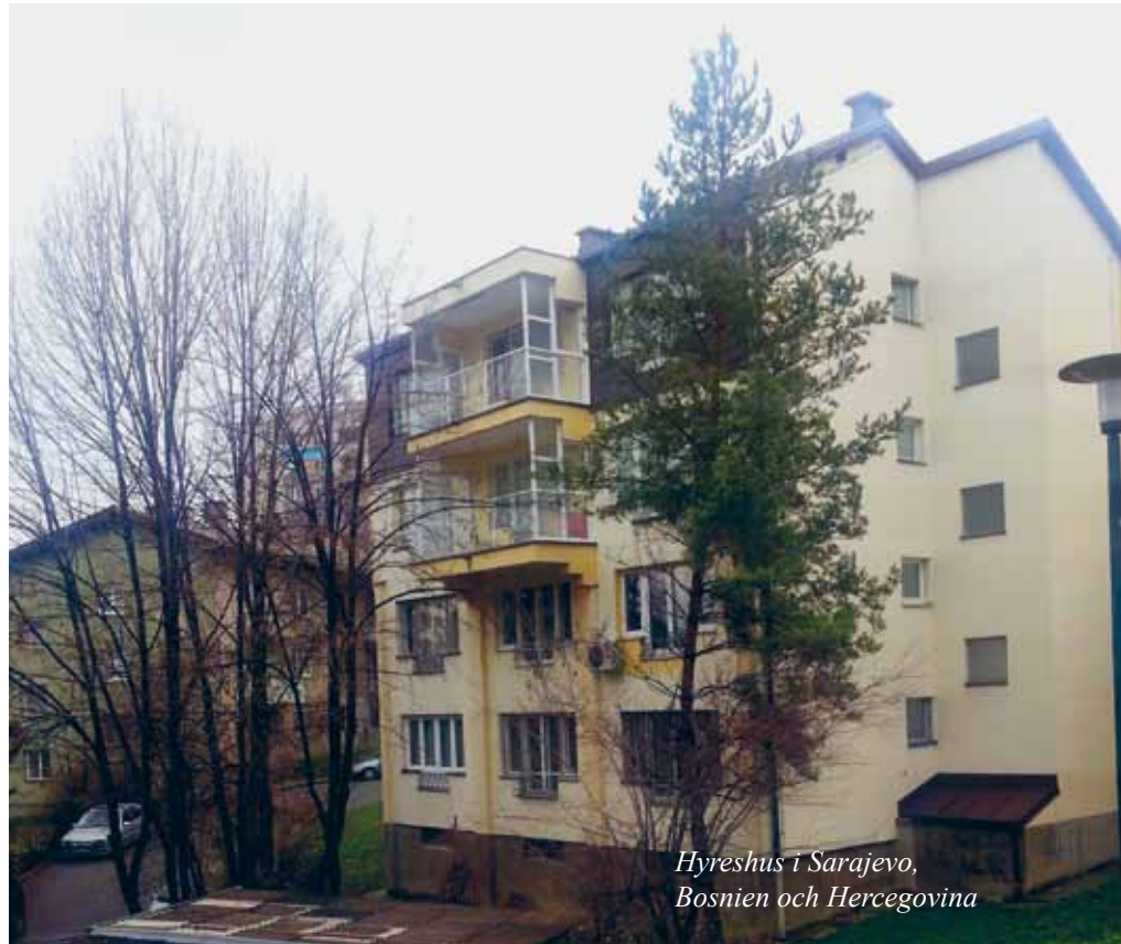
Hyreshus i Sarajevo, Bosnien och Hercegovina

husen är ofta modernare. Nya lägenheter har stora balkonger. Du kan lyssna på musik när du vill utan att grannarna hör. Det är inte lyhört. Hemma i Kortedala kan jag inte ens titta på TV utan att grannen knackar på dörren.